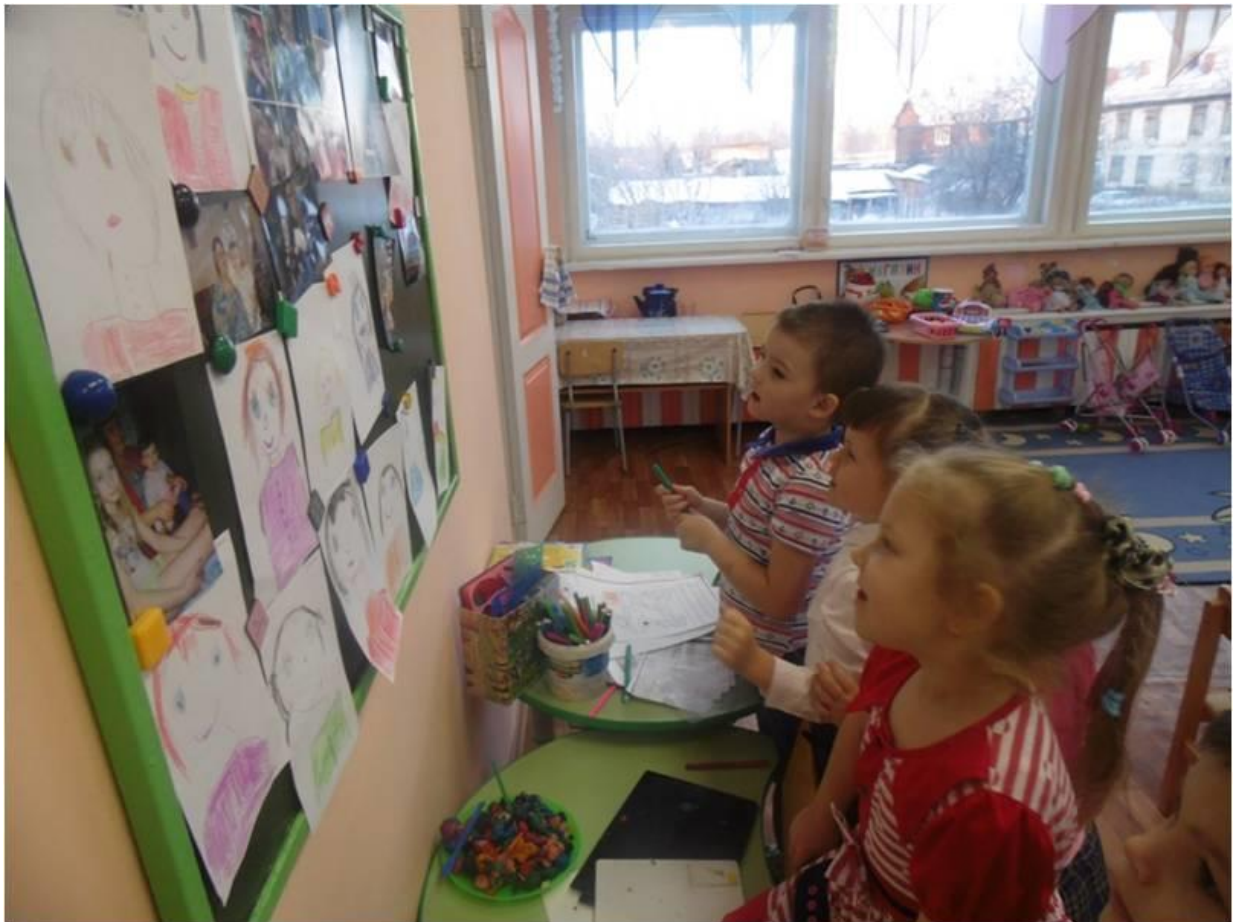
Делаем подарок для мамочек.