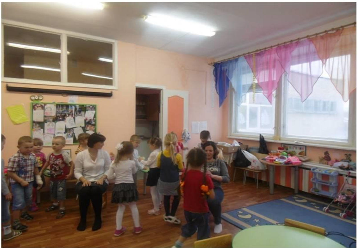
Оценивают свою работу.