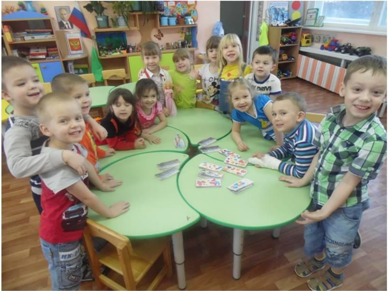
Работы наших мам.