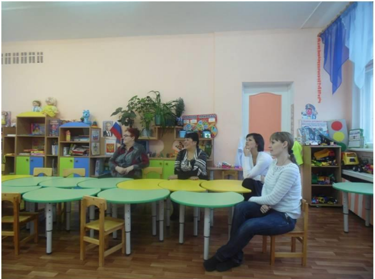
Мамы нашли своих детей.