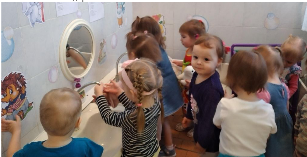
Беседа «Чистота – залог здоровья».

Продукт проектной деятельности: оформление стенгазеты «ЗОЖ нашей группы»; оформление папки – передвижки «ЗОЖ ребенка»; проведение спортивный праздник «В городе Здоровячков»; информационный материал в родительском уголке «Детское здоровье»; получение детьми знаний о ЗОЖ; повышение эмоционального, психологического, физического здоровья; повышение гигиенической культуры; улучшение соматических показателей здоровья.