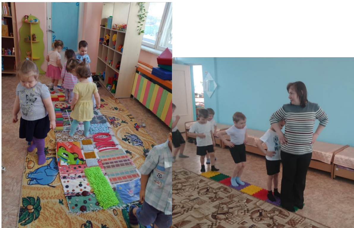
Ходьба по дорожке «Здоровья»