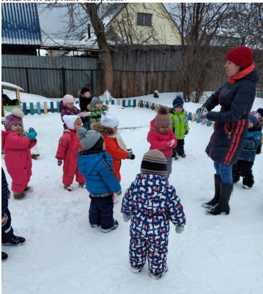
Прогулка на свежем воздухе.