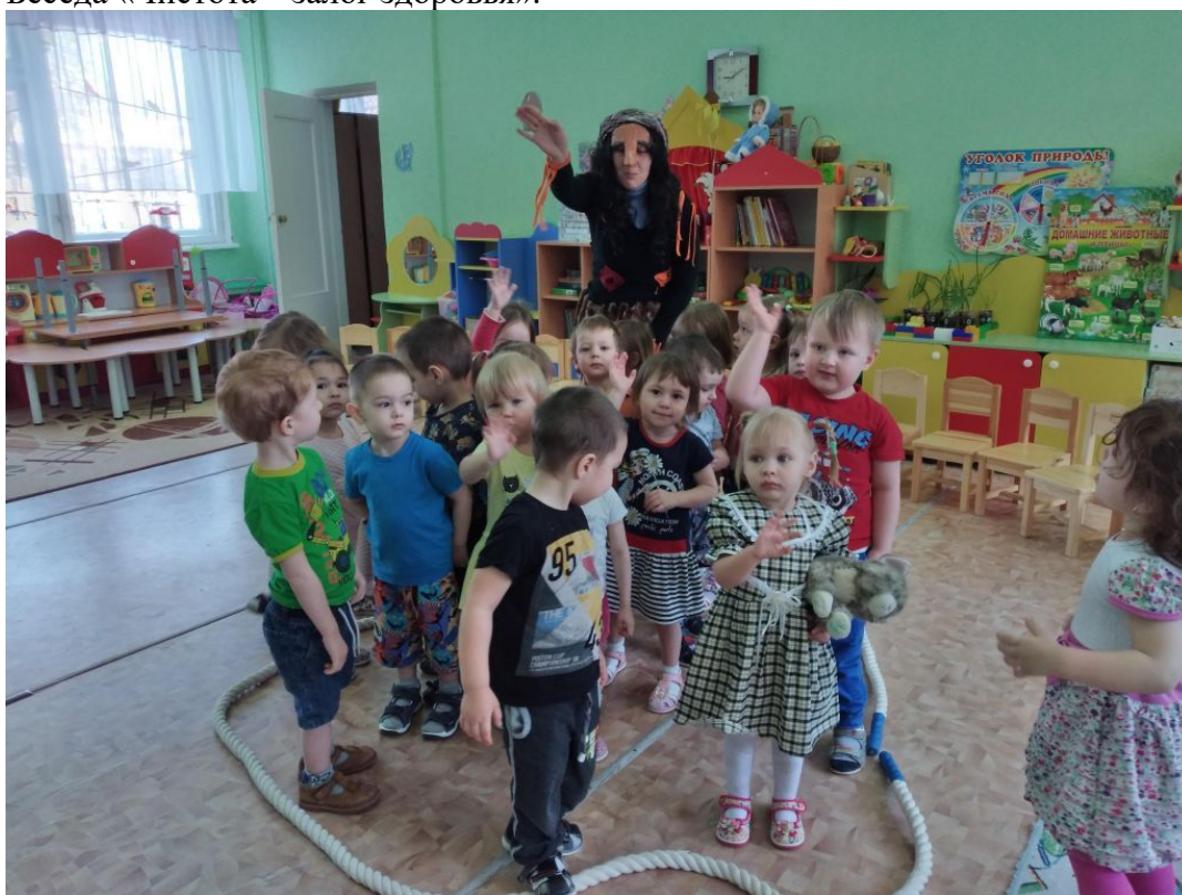
Спортивный праздник «В городе Здоровячков»