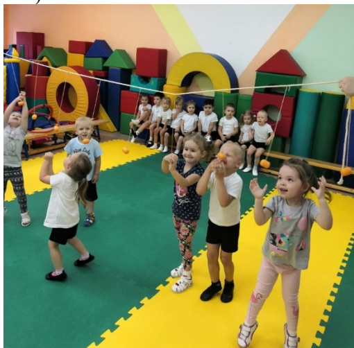
Рисунок 1. Дети прыгают за «орешками»

На веревках висят «орешки». Дети прыгают в высоту, доставая руками «орешки» (рис.1).