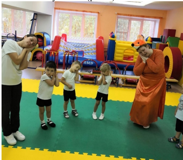
Рисунок 3. Танец

Танец под песню «Зайка серенький сидит» (Е.Железнова). Дети выполняют действия согласно тексту песни (рис.3).