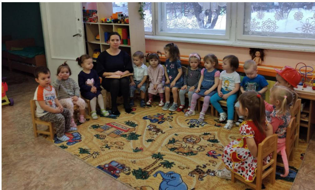
Чтение художественной литературы.